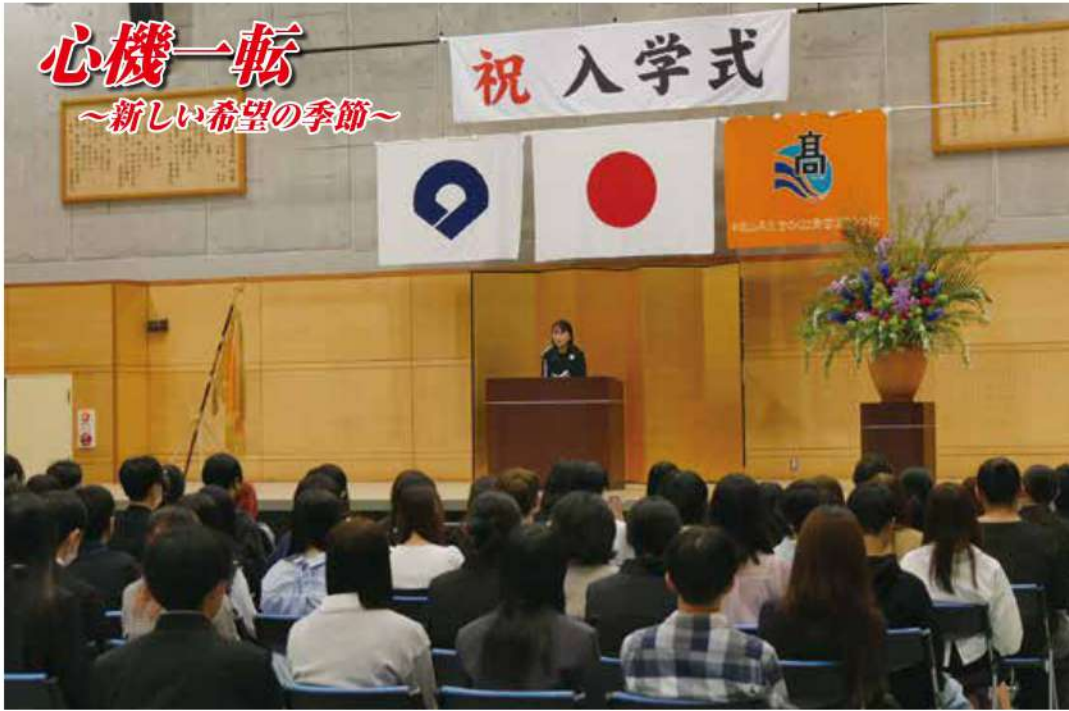
4月19日 入学生を迎えて