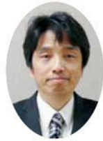
頭 洋 教 有本

本校通信制課程に赴任して、2年目を迎えることができました。在校生の皆さんには引き続き、入学生の皆さんはこれから、よろしくお祈りします。