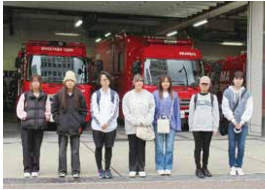
1B 南 愛心

本校恒例の学年行事では、各学年で計画を立て、和歌山市内にある文化施設や名勝を訪ねました。参加者は、さまざまな体験を通して歴史や文化に触れ、地域の良さを再発見することができました。また、参加者同士の交流を通じて親睦を深めるなど、秋の一日を有意義に過ごしました。