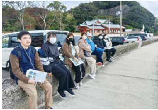
4F 的場 一晃

まず、最初に「めでたい電車」に乗り、面白いものがたくさんありました。魚の吊革、床にはあみだくじなどがあり、行きの電車から楽しく、その後もウォークラリーでいろんな所を巡り、道中で「揚げパン」を食べたのですが、とてもおいしかったです。 また、「よもぎ餅」もお土産に買え、とても楽しい学年行事になりました。