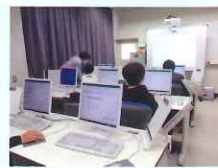
情報会計科授業風景